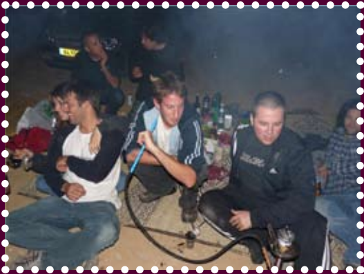
גיוני בפרופיל נמוך

ניתן לשלוח בדיחות, רביליות ותמונות לחייל duekmalc@bgu.ac.il